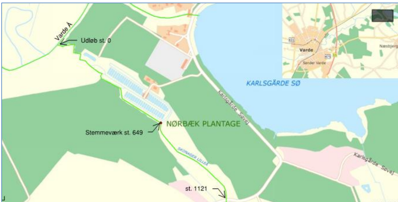
Fig. 1. Beliggenhed af Karlsgårde Dambrug. Målsætningen for Skonager Lilleå er god økologisk tilstand. DVFI 5 i forslag til vandplaner 2013.

Karlsgårde Dambrug er beliggende ved Skonager Lilleå umiddelbart inden udløbet i Varde Å.